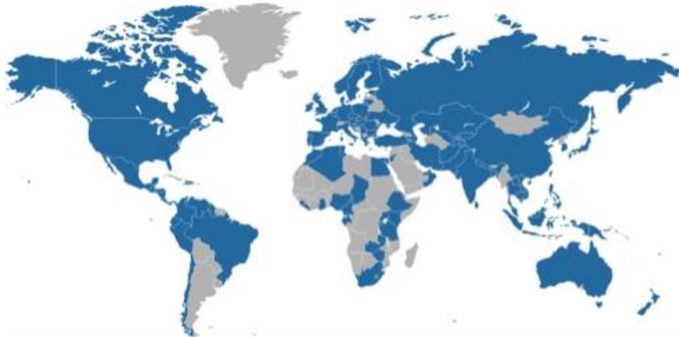
Las regiones sombreadas en el mapa anterior, son países que han participado con Student Energy.

Los estudiantes que han participado en las cumbres anteriores han trascendido en los diferentes ámbitos en los que se desenvuelven, desarrollándose como líderes del sector energético a nivel mundial. Ya sea creando proyectos propios o bien incorporándose a instituciones o empresas como Iluméxico, ONU, Shell, General Electric y ciertas agencias intergubernamentales como la OLADE, la IRENA, y la IEA.